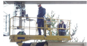
橋梁点検車による計測状況

中性子を用いて、非破壊でコンクリート内部の塩分濃度分布を把握 理化学研究所では、軽量で小さく取扱いが容易な中性子線源を用いて、橋梁 点検車に搭載可能な中性子塩分計RANS- \mu を世界で初めて開発 第7回「インフラメンテナンス大賞(国土交通大臣賞)」受賞